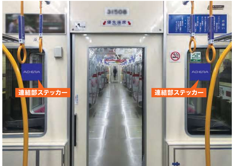
連結部ステッカー