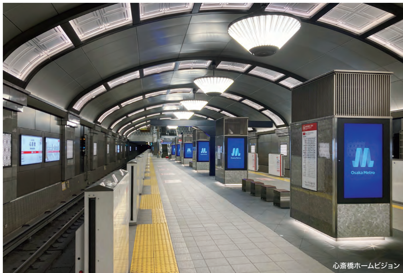
心齋橋ホームビジョン